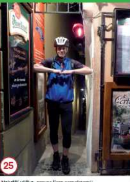
25 Nejužší ulička, provoz řízen semaforem!