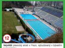
12 Největší plavecký areál v Praze, vybudovaný v bývalém kermatoku.