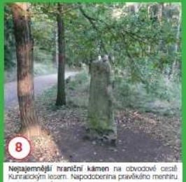
8 Nejstarejší hraniční kámen na obvodové části Křižovnickým náměstím. Nepodporuje pravidelnou menturu neuznávaného původu.