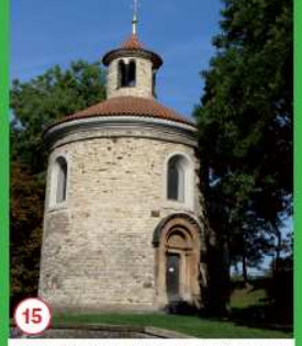
15 Nejstarší rotunda sv. Martina na Vyšehradě, postavena v 11. století za vlády krále Vratislava II.