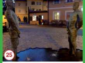
25 Nejprůběžnější mužské psací nedeje v nejužší uličce