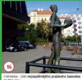
16 Fotbalistka - sídlo nejúspěšnějšího pražského basketbalového týmu.