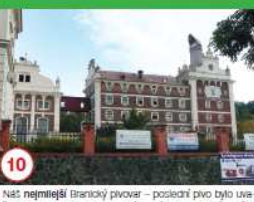
10 Naš nejmladší Branický pivovar - poslední piv bylo uvařeno v roce 2006. Autorem výjimečného pojednání zmečky Braník je Mikoláš Aleš.