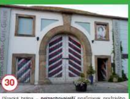
30 Pískácká brána - nejzachovělejší pozůstatek pražského barokního opevnění.