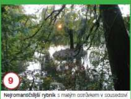
9 Nejromantičtější rybník s malým ostrovkem v sousedství novogotického kočovného zámku, který vznikl přestavbou klasického objektu v roce 1880.