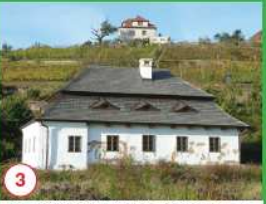
3 Jedna z nejstarších pražských větrných pochozí z 12. století. Větro se přiklápalo v Modřanech, až do roku 1909 kdy velké mrazy větro zmizely. V roce 1987 byla větrnice obnovena