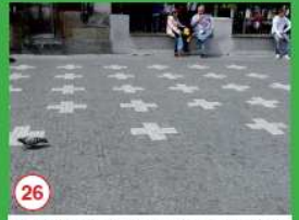
26 Největší dan českých dělníků v roce 1921, zasláno po pravě 27 vůdci Českého sovětského povstání