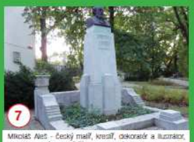
7 Mikoláš Aleš - český malíř, kreslil, dekoroval a ilustroval, jedna z nejvýznamnějších osobností tzv. „Generace Na rodnou dvádku“, kreslil českou umění 19. století