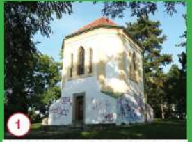
1 Nejzajímavější zvonec - Modřanská z roku 1754, na které zvony 2 zvony. Za 1.12. ozvělné zvony byly zvony pro vojenské účely zastaveny. Dnes je již bez zvonu.