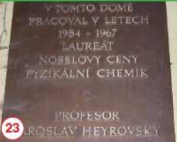
23 Dům, kde žil nejvýznamnější český fyzik prof. Jaroslav Heyrovský, hedeje v blízké stěpě uličce.