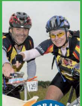
25 Nejprůběžnější mužské psací nedeje v nejužší uličce