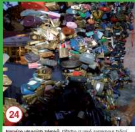
24 Najvíce visacích zámků. Přijďte si i své zamknout! Bítal ...