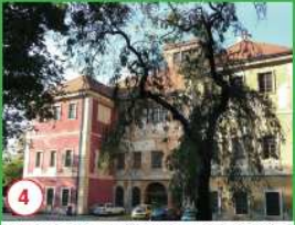
4 Kurfürstský zámek - byl vybudován u jezírka z nejoblíbenějších pražských peněz peněz již roku 1888 na zápisoch Kurfürstské tvrze.