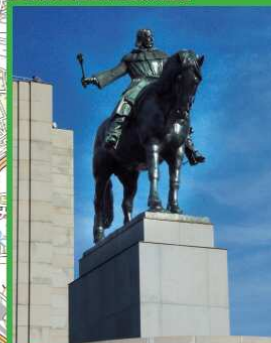
27 Nejmonumentálnější jezdecká socha v Praze. Byla otcována jako největší pomník svého druhu na světě, je devět metrů vysoká a váží 16,5 tuny. Autorem je Bohumil Kaifek.