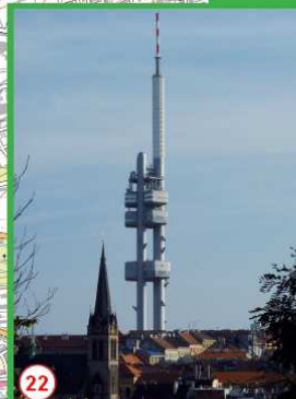
22 Nejvyšší stavba v Praze. Věž vysoká 216 metrů byla postavena v letech 1986–1992 podle návrhu architekta Václava Aulického.